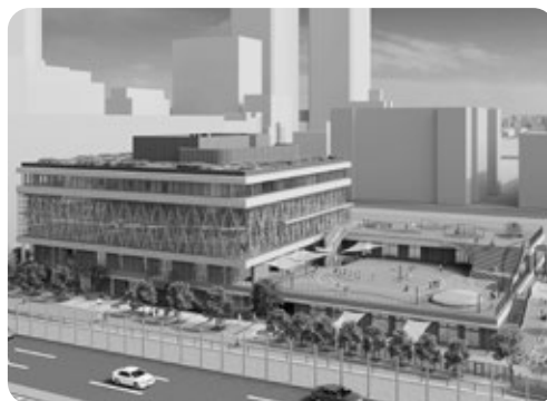
渋谷教育学園 晴海西こども園